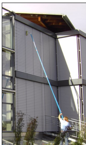
ou nettoyage de stores....