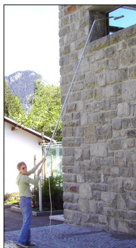
léger et facilement maniable... sans danger d'accidents!