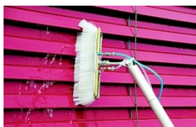
brosse spéciale pour nettoyage de stores à lamelles

Depuis 30 ans, STRATO garantit la qualité constante et stable de ses produits de QUALITE SUISSE. Nous attachons beaucoup d'importance aux conseils individuels et sur demande, nous présentons les produits de votre choix et les adaptons à vos besoins.