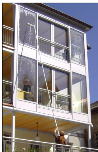
Vitrages ou cadres...

Depuis 30 ans, STRATO garantit la qualité constante et stable de ses produits de QUALITE SUISSE. Nous attachons beaucoup d'importance aux conseils individuels et sur demande, nous présentons les produits de votre choix et les adaptons à vos besoins.